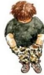
De dubbel bijzondere leerling

"HOEZO "WE HEBBEN DIT TOCH AFGESPROKEN?" IK HEB HELEMAAL MIJNS MET U AFGESPROKEN..."