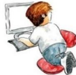
De zelfsturende autonome leerling