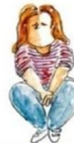
De onderduikende leerling