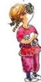
De uitdagende creatieve leerling