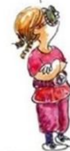
De uitdagende creatieve leerling