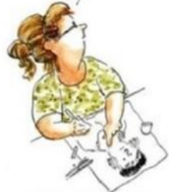
De aangepaste succesvolle leerling