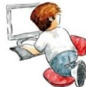
De zelfsturende autonome leerling