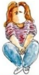
De onderduikende leerling

"...DE MIJ TOCH MAAR GEEEN PROBLEEM-- VEEL TE MOEILYK--"