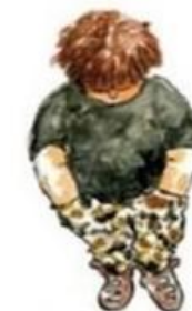
De dubbel bijzondere leerling