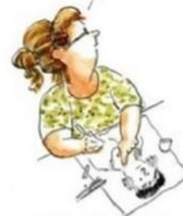
De aangepaste succesvolle leerling